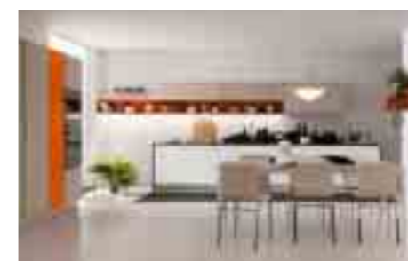
COMP 5 / PAG 66-79

Antine colonne: laccato lucido NCCS 5010R30B viola con presa maniglia Antine basi: Pembroke rovere bianco S126 con presa maniglia Antine pensili: Pembroke rovere bianco S126 4 bordi dritti ABS con presa maniglia Pensili a giorno: laccato lucido NCCS 5010R30B viola sp. 12 Spalle: Pembroke rovere bianco S126 Top inox: Aisi 304 satinato 10/10 barazza sp.14 cm con piano cottura B-free stampato sul piano e vasca 71X40 R15 saldata al piano Top: laminato bordo unicolor bianco 136 sp.2 cm Tavolo bancone: Pembroke rovere naturale S128 sp. 4 cm con supporto acciaio inox Aisi 304 Sedie: Tess bianche con cuscino Forno: Barazza serie Feel 1FFYP Microonde: Barazza serie Feel 1MCFY Lavastoviglie: Electrolux TT1013R5 Misceleatore: Newform ERGO 65925.21.018 cromato Frigo congelatore: Electrolux FI3342DV Cappa: Falmec Prisma parete da 115 inox/vetro bianco Zoccolo: alluminio finitura inox lucido Gola: finitura inox lucido Basi angolo: mecc. Magic corner con cesti Ring Illuminazione sottopensili: a led solaris UC