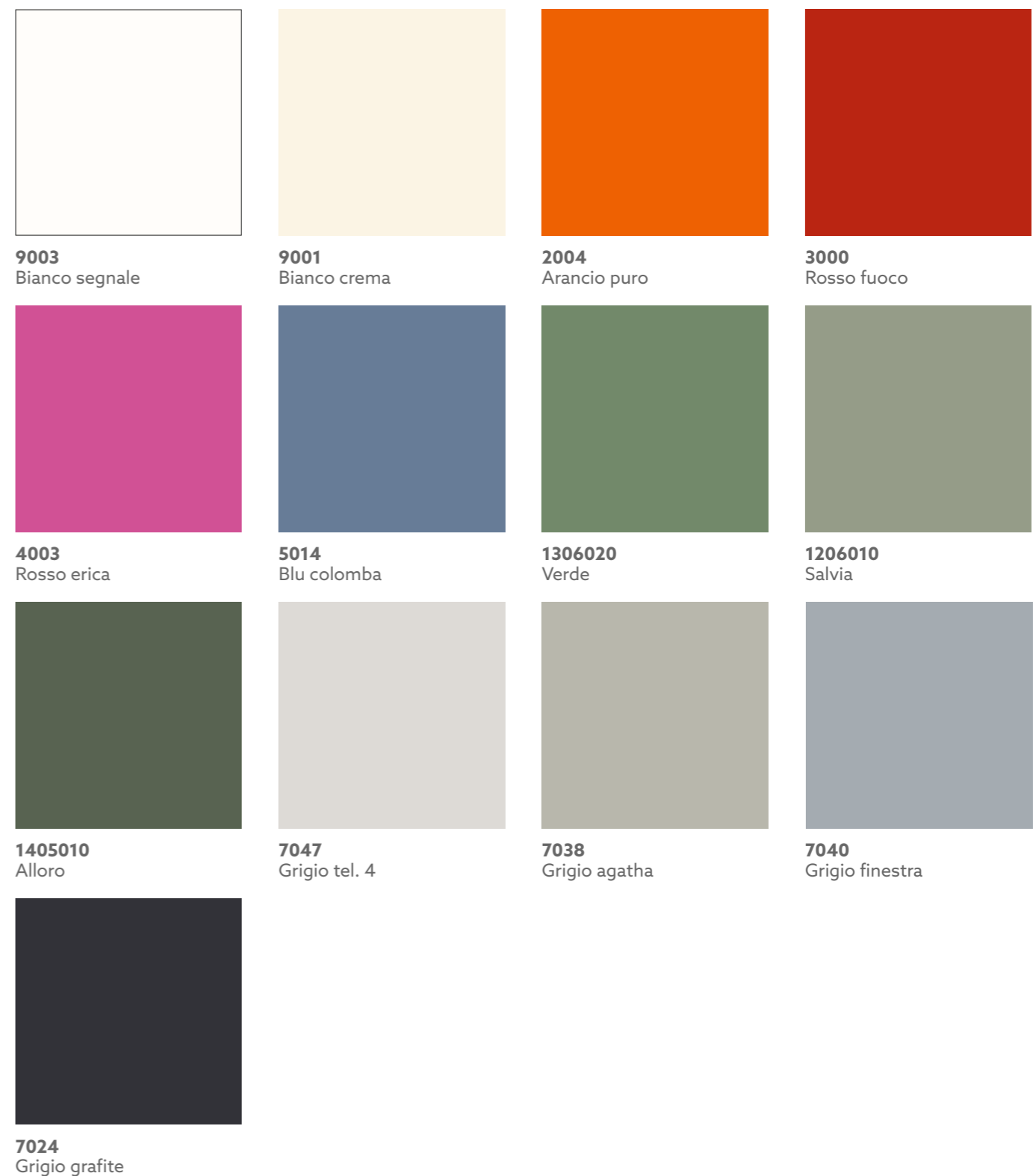
9003 Bianco segnale