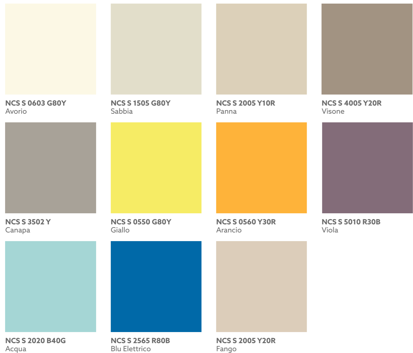
NCS S 0603 G80Y Avorio