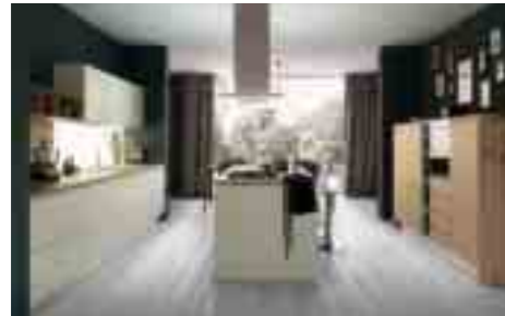
COMP 1 / PAG 04-17

Antine colonne: Pembroke rovere naturale S128 Antine pensili: laccato sabbia opaco NCCS1505 G80Y con 4 bordi ABS Antine isola, basi: laccato sabbia opaco con presa maniglia NCCS1505 G80Y Retro bancone, spalle, base e colonna a giorno: laccato sabbia opaco NCCS1505G80Y Pensili a giorno, top colonne: Pembroke rovere naturale s128 Piani tops: Fenix color FX 2628 sp.4cm Tavolo: Fusion, struttura creta, piano Pembroke s128 Sedie: Tess creta con cuscino Forno: Hotpoint Ariston OK1037ENDOX/HA Lavastoviglie: Hotpoint Ariston LTF11H132OEU Frigo semicolonna: Hotpoint Ariston BS2332 Congelatore: Hotpoint Ariston BF 2022.1 Piano cottura: Barazza Officina filotop 1POF80 Lavello: Barazza filotop 1X842I Misceleatore: Barazza B-Open 1 rubmboc. cromato Cappa: Falmec "Zenith" isola con mensola vetro bianco satinato illuminato Zoccolo: alluminio finitura inox lucido Schienale luminoso a led "Solaris"