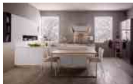
COMP 2 / PAG 18-31

Antine colonne: Pembroke rovere naturale S 128 4 bordi dritti abs - colonna da 30 laccato opaco grigio tel. 4 ral 7047 Antine basi, pensili, bancone isola: laccato opaco grigio tel.4-ral 7047 4 bordi R 2 mm Antine soggiorno: laccato opaco grigio tel. 4 ral 7047, grigio agatha ral 7038, verde 1306020, canapa NCCS 3502Y, acqua NCCS 2020 B40G 4 bordi R=2mm. Pensili a giorno: Pembroke rovere naturale S 128 Top basi + isola: Dekton Vegha sp.4cm Spalle isola, schienale cucina: Dekton Vegha sp.2cm Tavolo bancone: Pembroke rovere naturale S128, sp. 3,6 cm con supporto tubolare acciaio inox Sedie: Tess base grafite, scocca bianca con cuscino Forno: Barazza Feel 1FFYP Microonde Barazza Feel 1MCFY Cassetto scaldapiatti: Barazza Feel 1 CEFY Lavello: Barazza 1LLB 952-Lab Piano cottura: Barazza 1PLB5-Lab Lavastoviglie: Electrolux TT 2003 R3 Frigo congelatore: Electrolux FI3342DV Cappa: Falmec Marilyn E-ION isola bianca Misceleatore: Barazza B-OPEN cromato 1 Rub M BOC Zoccolo: alluminio brunito Gola: alluminio brunito Colonna: da 30 col. Estraibile motorizzata con cesti Ring Colonna angolo: mecc. Colonna ad angolo Fly Moon con cesti Ring Illuminazione sottopensili: a led Malindi+ Bali ( x scolapiatti) Illuminazione interna colonne: a led barra Noor