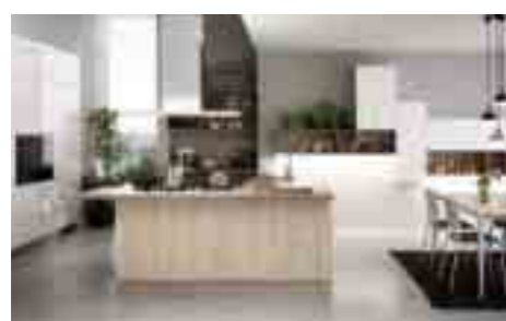
COMP 3 / PAG 32-49

Antine basi: bianco opaco ral 9003 con presa maniglia Antine pensili: Pembroke rovere sbiancato s123 4 bordi dritti ABS Antine colonne: Pembroke rovere sbiancato s123+ 1 anta arancio opaco ral 2004 con presa maniglia Pensili a giorno: arancio opaco ral 2004 sp.12 mm Spalle x basi: marmo agglomerato juta grisè sp.2cm Top cucina: marmo agglomerato juta grisè sp.2cm Tavolo: Fusion struttura laccato bianco, piano Pembroke rovere sbiancato S123 Sedie: Lira con base cromolucido, seduta a schienale impiallacciato rovere tinto sbiancato S123 Forno: Whirlpool ambient AKZM 775/IXL Forno a microonde: Whirlpool AMW842/IXL Lavastoviglie: Whirlpool WP122 Frigocongelatore: Whirlpool art. 9811/A++SF Misceleatore: Newform Ycon 64215.21.018 Lavello: Foster 2206850 vasca inox sottop Piano cottura: Foster 7332240 ad induzione - filotop Cappa: sottopensile S13 Maxfire da 120, con veletta inox Zoccolo: alluminio finitura inox lucido Illuminazione sottopensili: a led solaris UC Schienale: alluminio stratificato sp.3 mm con decorazione Venezia