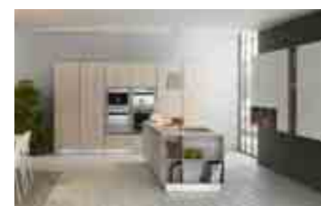
COMP 6 / PAG 80-95

Antine colonne: laccato bianco lucido RAL 9003 con presa maniglia Antine basi: Pembroke rovere sbiancato S123 con presa maniglia Antine soggiorno: laccato bianco lucido RAL 9003 4 bordi dritti ABS Pensili a giorno: Pembroke rovere sbiancato S123 sp. 12 Mensole, retro bancone, spalla: Pembroke rovere sbiancato S123 Top: laminato bordo unicolor grigio 200 sp. 4cm Tavolo: Fusion fusto bianco, piano Pembroke rovere sbiancato S123 Sedie: Tess bianche con cuscino Forno: Foster 7105642 black mirror Microonde: Foster 7104620 black mirror Cassetto scaldapiatti: Foster 7104600 black mirror Piano cottura: Foster 7607032 filotop inox Lavello: Foster 4385050 filotop inox Misceleatore: Newform libera 63930.21.018 Lavastoviglie: Whirlpool WP108 Frigo congelatore: Whirlpool art 9811/A++ SF Cappa: Falmec Zenith 120 isola Zoccolo: alluminio finitura inox lucido Colonna: con meccanismo Tandem, cesti Ring Illuminazione sottopensili: a led solaris UC Illuminazione interna colonne: a led barra Noor