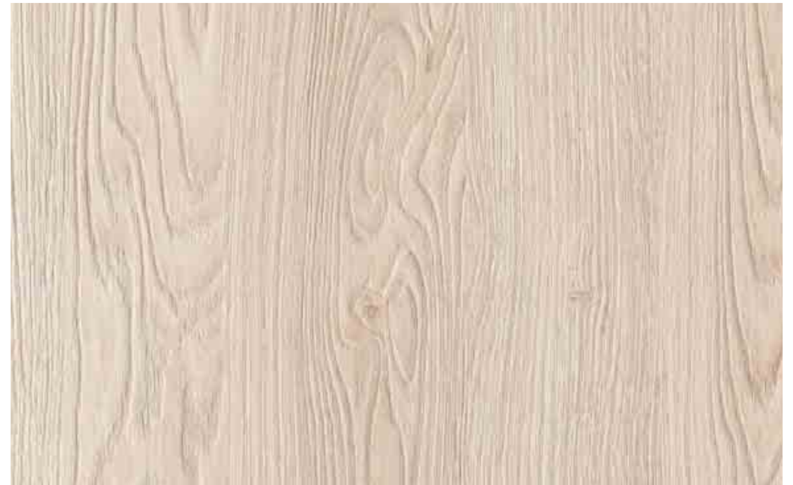
EFFRA S123 Rovere sbiancato