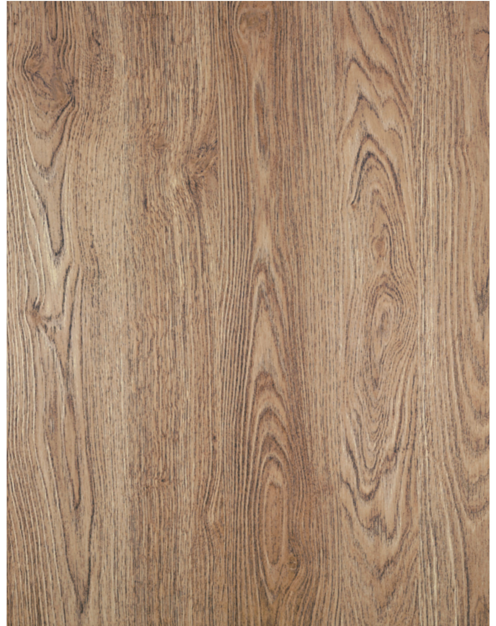
HACNEY BROOK S128 Rovere naturale