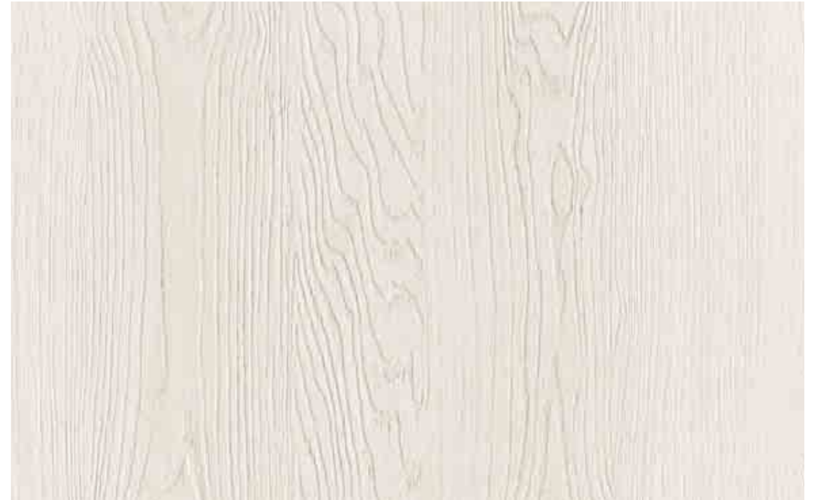
WALBROOK S126 Rovere Bianco