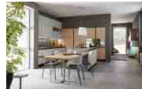
COMP 4 / PAG 50-65

Antine colonne: Pembroke rovere naturale S128 Antine pensili: laccato sabbia opaco NCCS1505 G80Y con 4 bordi ABS Antine isola, basi: laccato sabbia opaco con presa maniglia NCCS1505 G80Y Retro bancone, spalle, base e colonna a giorno: laccato sabbia opaco NCCS1505G80Y Pensili a giorno, top colonne: Pembroke rovere naturale s128 Piani tops: Fenix color FX 2628 sp.4cm Tavolo: Fusion, struttura creta, piano Pembroke s128 Sedie: Tess creta con cuscino Forno: Hotpoint Ariston OK1037ENDOX/HA Lavastoviglie: Hotpoint Ariston LTF11H132OEU Frigo semicolonna: Hotpoint Ariston BS2332 Congelatore: Hotpoint Ariston BF 2022.1 Piano cottura: Barazza Officina filotop 1POF80 Lavello: Barazza filotop 1X842I Misceleatore: Barazza B-Open 1 rubmboc. cromato Cappa: Falmec "Zenith" isola con mensola vetro bianco satinato illuminato Zoccolo: alluminio finitura inox lucido Schienale luminoso a led "Solaris"