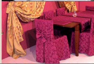
tovagliati e coprisedia