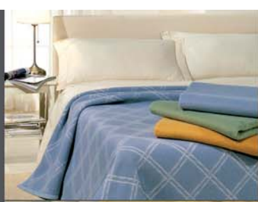
biancheria da letto