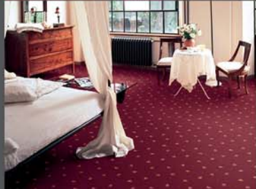
tappeti & moquette