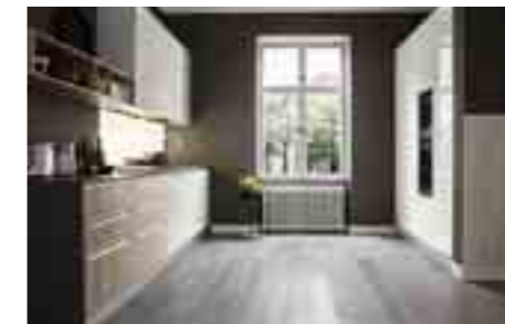
COMP 5 / PAG 54-65

Antine basi e colonne: rovere nodato naturale Antine isola: bianco lucido Spalle e vani a giorno isola: bianco lucido Piani tops: laminato Fenix con bordo fenixcolor FX2628 sp. cm 4 Schienale: lavagna su supporto alluminio stratificato spessore 3 mm Forni: barazza serie Lab. inox 1FLBPI Contenitori x forni: Barazza in acciaio inox Piano cottura: Barazza da 80. 4 fuochi + tripla corona serie Officina montato a filotop - 1POF80 - INOX Lavello: Barazza da 75x44 2 vasche " Quadra R15 " inox - montato a filotop - 1X842I Miscelatore: Barazza B-open RUBMBOC - cromato Frigorifero: Electrolux F13342 DV monoporta Congelatore: Electrolux C13301 DN monoporta Cappa: Falmec Marilyn isola E- ION- bianca Lavastoviglie: Electrolux TT2003R3 Zoccolatura: alluminio fin. inox lucido Tavolo: Diamante fusto bianco, piano Fenix FX2628 sp. 1.2 cm Sedie: Eva bianche Sgabelli: Erika fusto cromato, seduta bianca