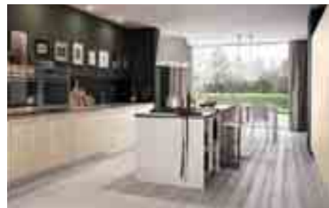
COMP 2 / PAG 18-27

Antine colonne e pensili: bianco opaco Antine base isola: olmo grigio Pensili a giorno: bianco opaco Top, spalle isola e lavello: unicolor/unicolor malta bianca sp.2 cm con lavello integrato rivestito dello stesso materiale. Forno: Electrolux FQ203IXEV Microonde: Electrolux FQM465ICXE Cassetto scaldapiatti: Electrolux EED14700OX Lavastoviglie: Electrolux TT2003 R3 Piano cottura: Electrolux KT18500 BE ad induzione Frigorifero: Electrolux F13342 DV Congelatore: Electrolux C13301 DN Miscelatore: Newform Moony 3110.21.018 Colonna dispensa: estraibile da 60 con cesti Ring Colonna dispensa: da 60 con cassette estraibili Ring Zoccolatura: alluminio fin. inox lucido Illuminazione sottopensile: a led solaris UC con interruttore sensor Illuminazione interna colonne: a led barra noor con infrared Cappa: Falmec Zenith da 120 isola con mensola illuminata