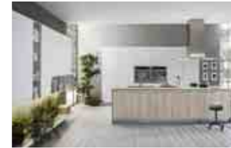
COMP 4 / PAG 42-53

Antine: bianco opaco Contenitori a giorno: rovere sp. 1.2 cm Mensola usotop soggiorno: rovere sp.2 cm Tops: laminato postformati Luserna bianco luna 3355 sp. 4 cm Penisola: laminato postformato luserna bianco luna 3355 sp. 4 cm - supporto inox - Schienali: laminato Luserna bianco luna 3355 Forno: Whirlpool AKZM 6550/IXL Microonde: Whirlpool AMW 698/IXL Piano cottura: Whirlpool GOF 7523/TB Frigorifero: Whirlpool ART 9811 A++ SF Lavastoviglie: Whirlpool WP122 Lavello: Barazza serie Easy 86.50 2vs - inox Miscelatore: Newform Libera 63930.21.018 cromato Cappa: sottopensile da 120 con veletta inox Base angolo: meccanismo Magic Corner con cesti Ring Colonna dispensa ad angolo: con 5 ripiani a fagiolo Ring - illuminazione barra led Noor Illuminazione sottopensile: a led Solaris UC con interruttore Sensor Zoccolatura: alluminio fin. inox lucido Sedie: Lira - basamento cromato, seduta monoscocca in multistrato