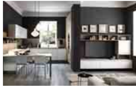
COMP 1 / PAG 04-17

Antine: bianco opaco Contenitori a giorno: rovere sp. 1.2 cm Mensola usotop soggiorno: rovere sp.2 cm Tops: laminato postformati Luserna bianco luna 3355 sp. 4 cm Penisola: laminato postformato luserna bianco luna 3355 sp. 4 cm - supporto inox - Schienali: laminato Luserna bianco luna 3355 Forno: Whirlpool AKZM 6550/IXL Microonde: Whirlpool AMW 698/IXL Piano cottura: Whirlpool GOF 7523/TB Frigorifero: Whirlpool ART 9811 A++ SF Lavastoviglie: Whirlpool WP122 Lavello: Barazza serie Easy 86.50 2vs - inox Miscelatore: Newform Libera 63930.21.018 cromato Cappa: sottopensile da 120 con veletta inox Base angolo: meccanismo Magic Corner con cesti Ring Colonna dispensa ad angolo: con 5 ripiani a fagiolo Ring - illuminazione barra led Noor Illuminazione sottopensile: a led Solaris UC con interruttore Sensor Zoccolatura: alluminio fin. inox lucido Sedie: Lira - basamento cromato, seduta monoscocca in multistrato