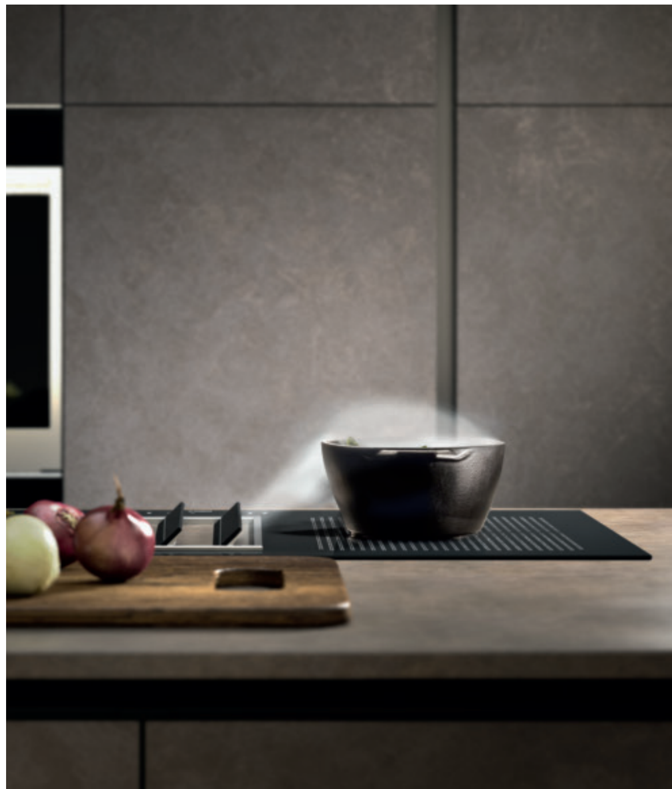
Piano cottura induzione da 88 cm. Quantum di Falmec con aspirazione integrata. 88 cm wide Quantum by Falmec induction hob with integrated suction. Plan de cuisson à induction de 88 cm. Quantum de Falmec avec aspiration intégrée.