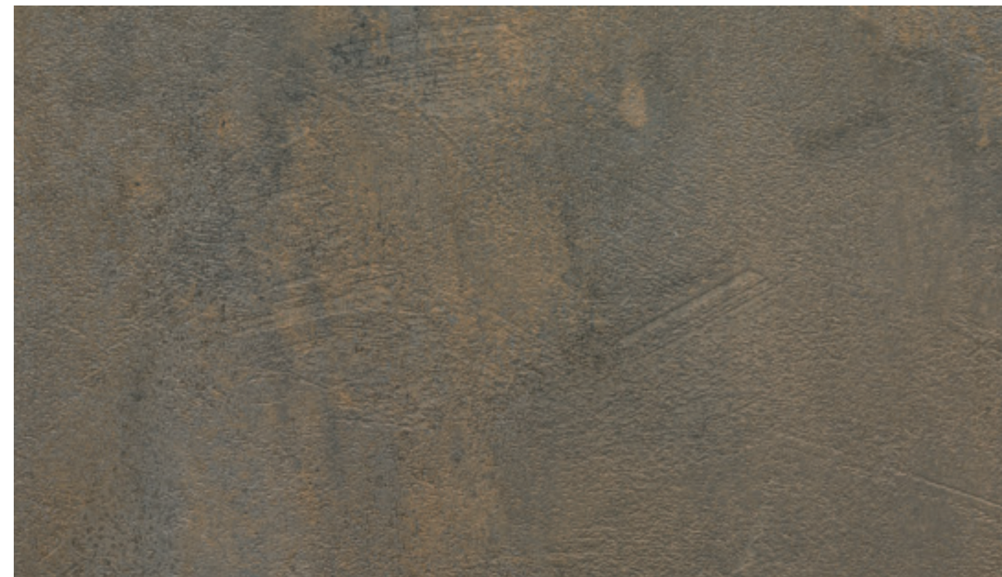
Ossido chiaro FB47