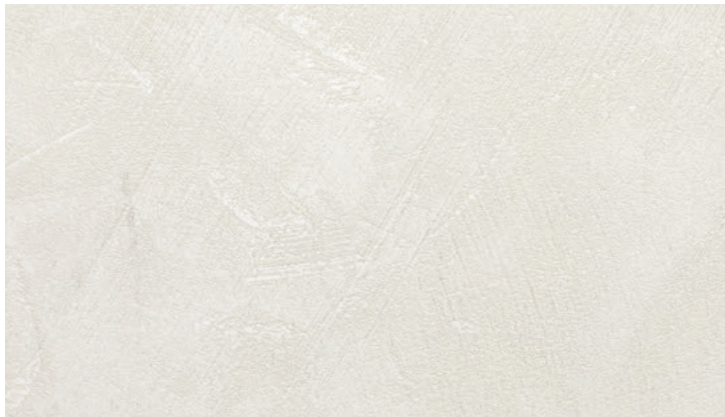
Ecomalta bianco FB50