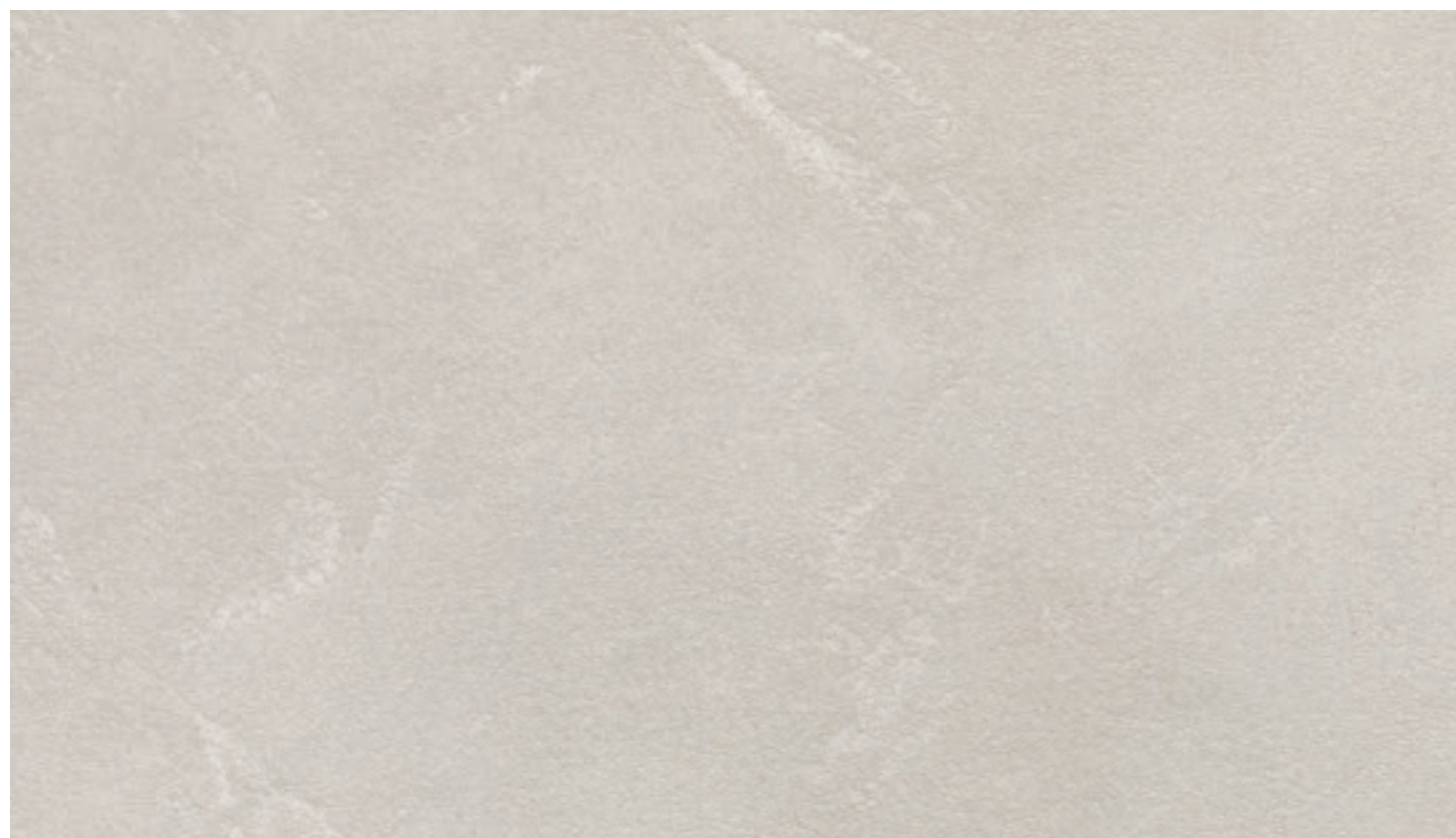
Ecomalta muro FB45