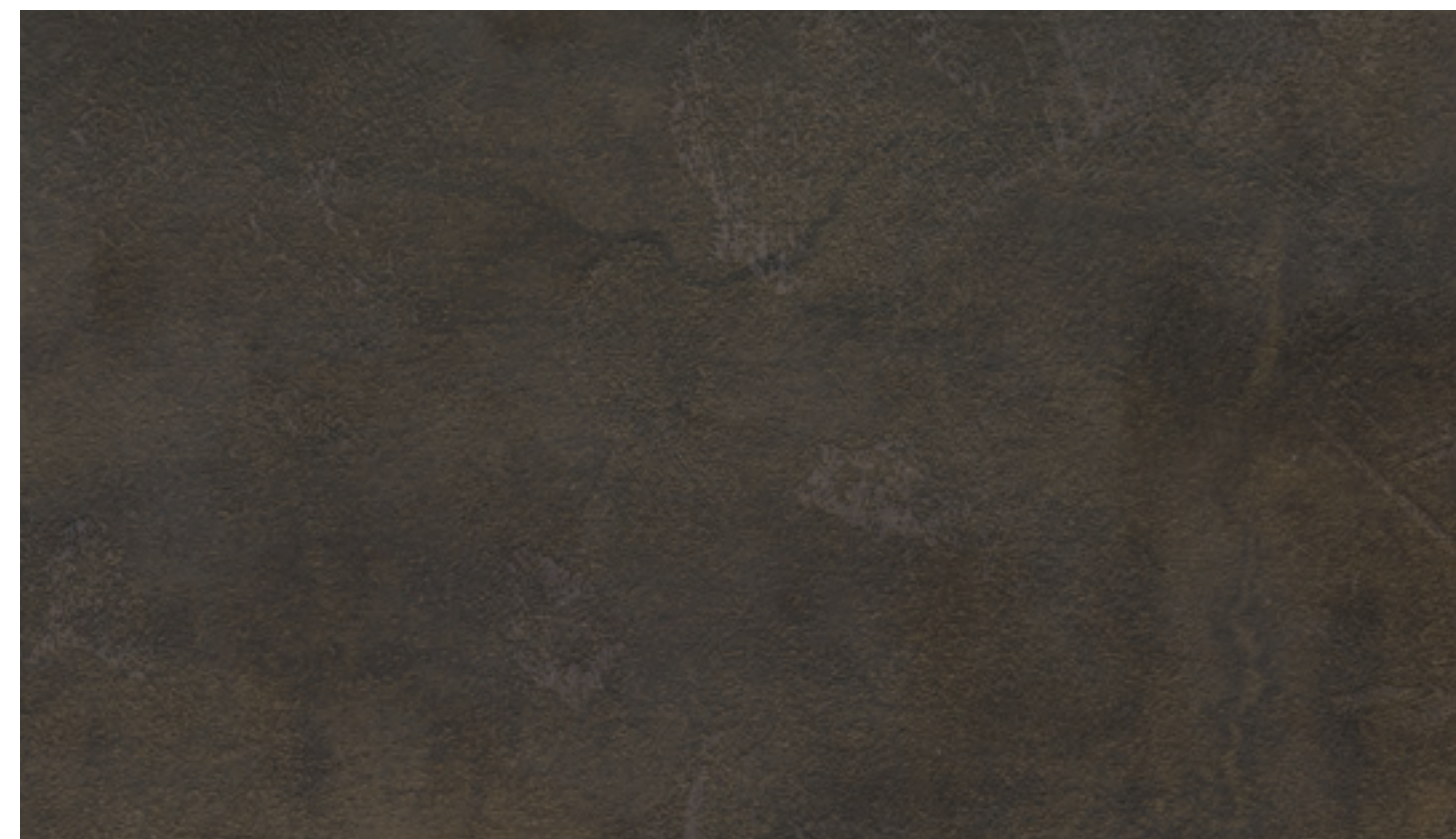
Ossido scuro FB49