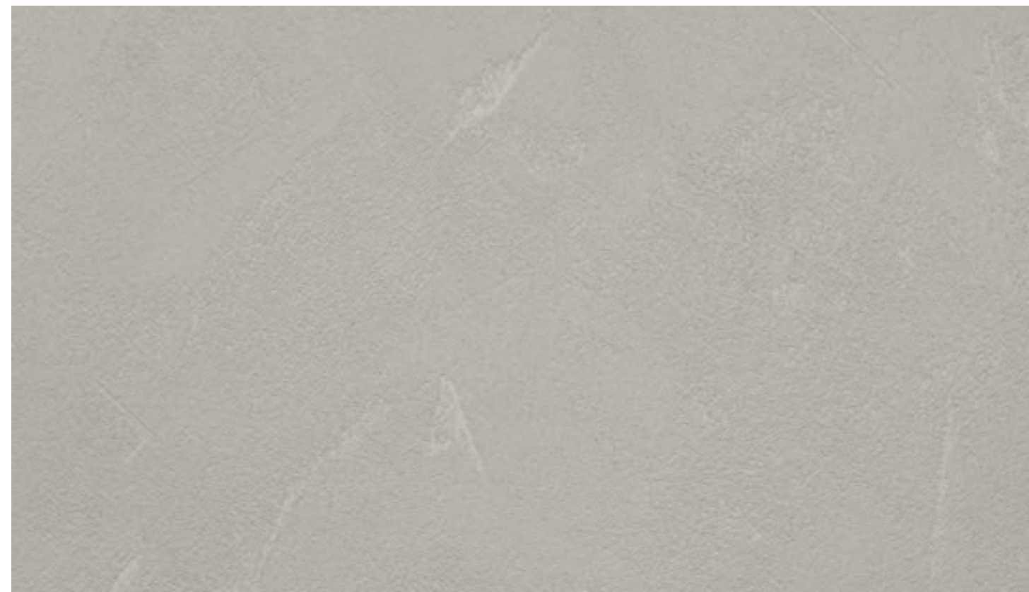
Ecomalta beton FB53