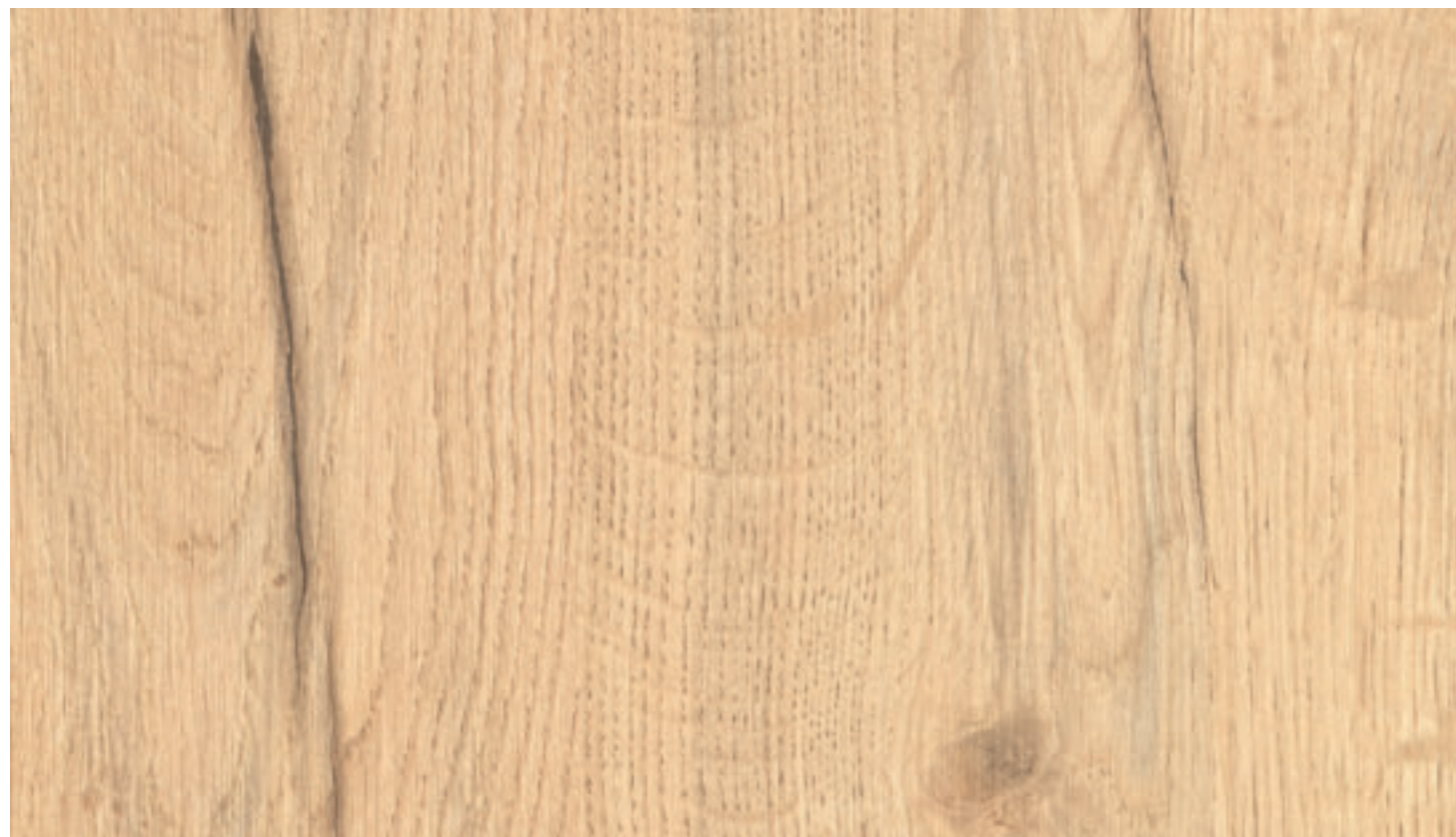
Rovere Vintage Naturale LR33