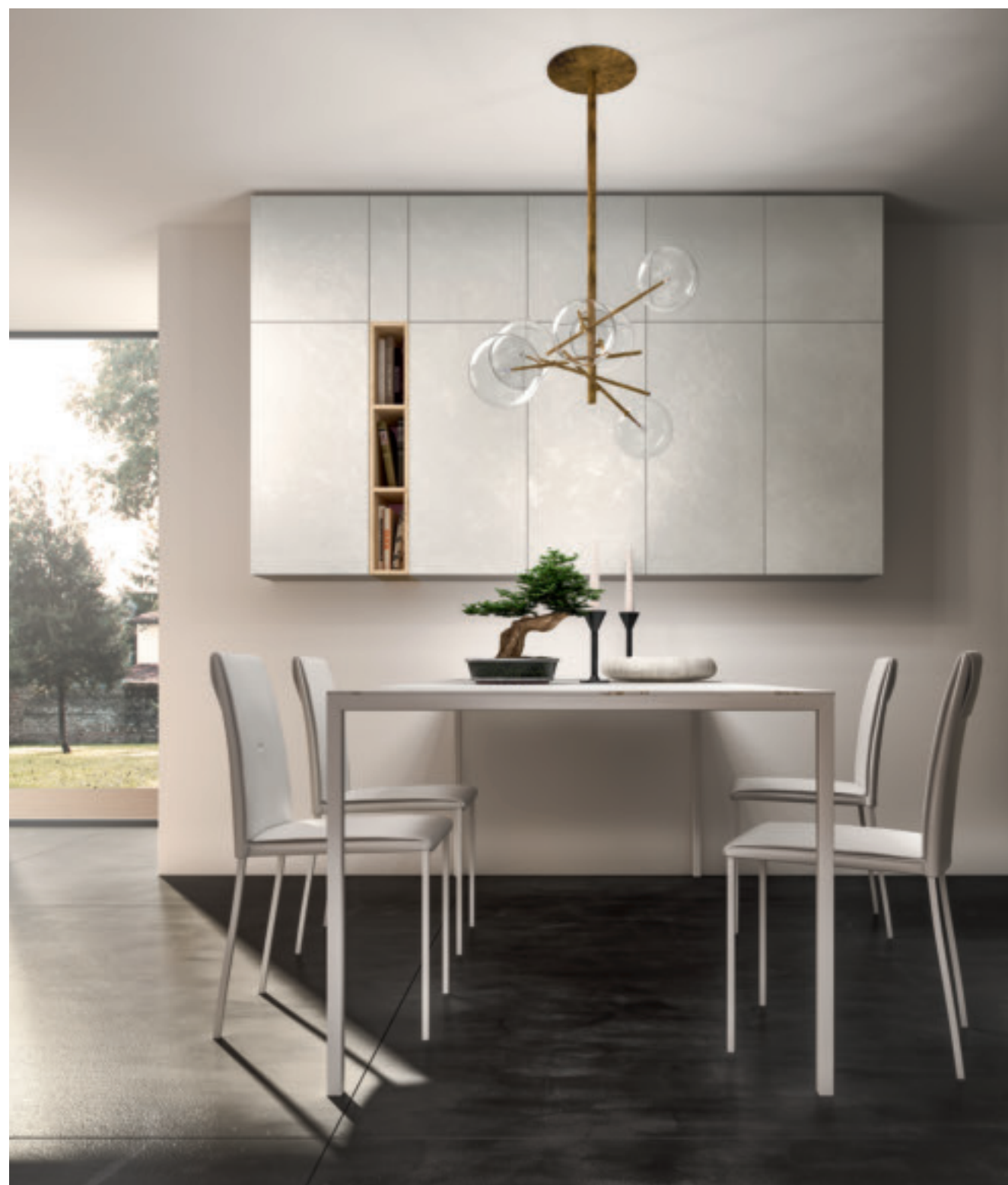
Tavolo minimal bianco con sovrapiano in Stone Calacatta sp. 1,2 cm. sedie Gaia con cuscino ecopelle bianca. Minimal Bianco table with over top unit in 1.2cm thick Stone Calacatta, Gaia chair with white ecoleather cushion. Table minimal Bianco avec sur-plan en Stone Calacatta sp. 1,2 cm. chaise Gaia avec coussin écocuier blanc.